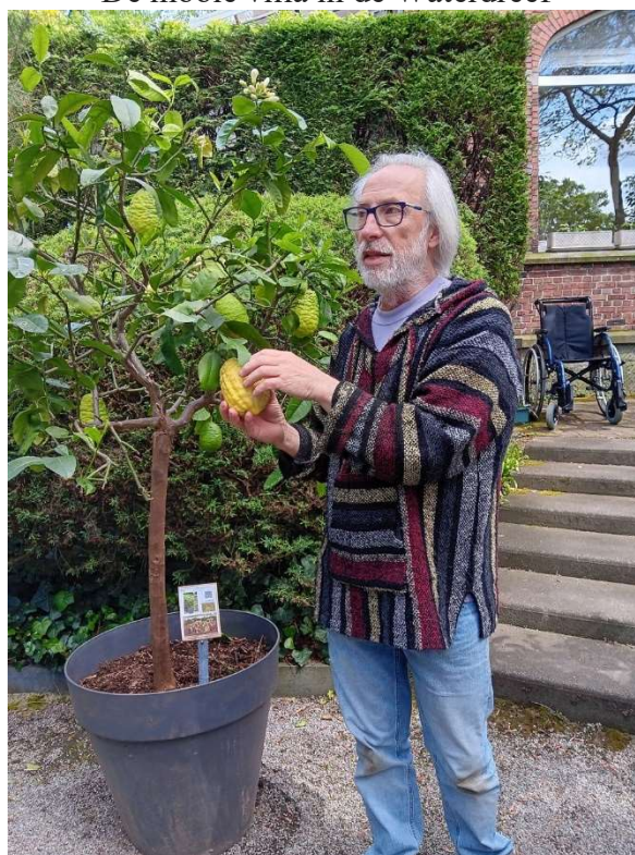
De eigenaar is een enthousiaste verteller, hij geeft veel uitleg over al de planten.