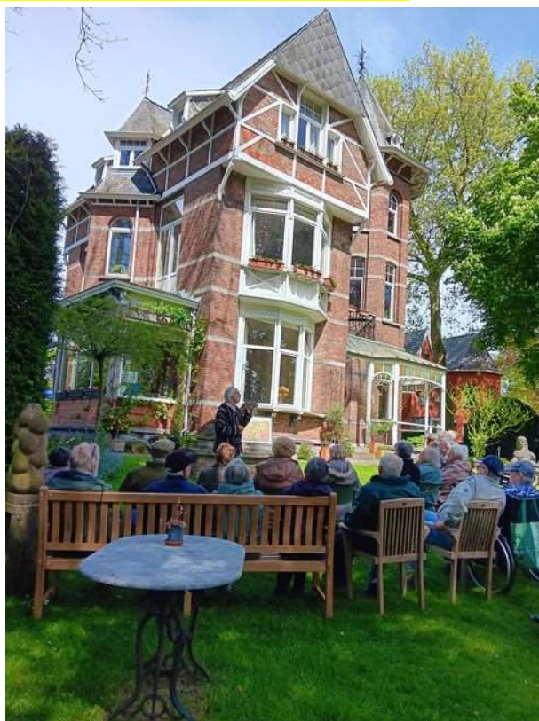
De mooie villa in de Waterdreef