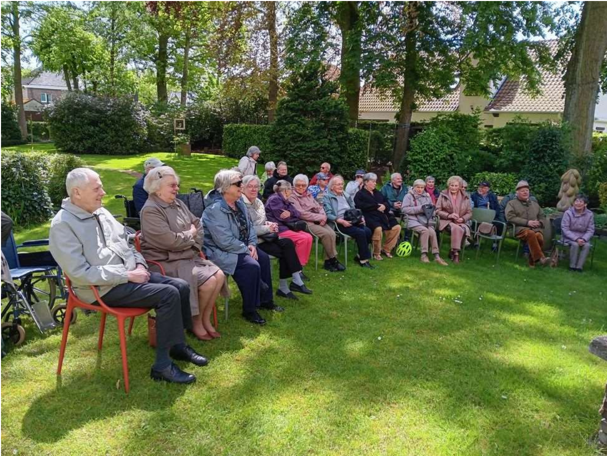
Het was een beetje fris, maar gelukkig scheen de zon in de tuin van villa Emma.